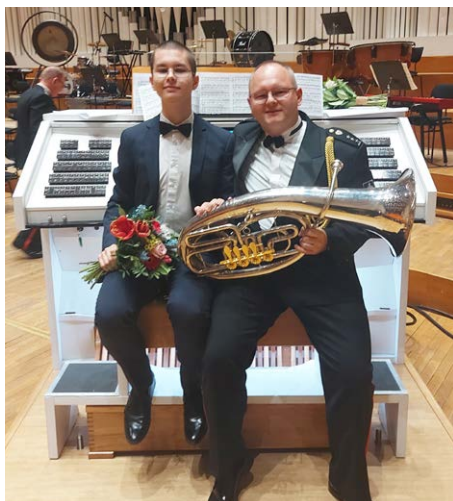
Otec a syn, dvaja skvelí hudobníci

Zhovárala sa: Ivana