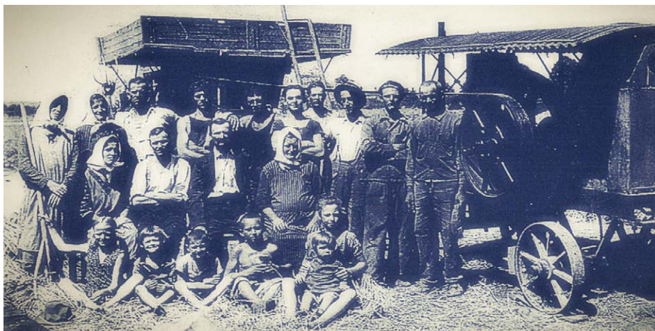
Drösing 1932, žatva, spomienka na prácu v Rakúsku.

6. januára si pripomínáme sviatok Zjavenia Pána, ktorý sa nazýva aj sviatok Troch kráľov. Patrí medzi najstaršie kresťanské sviatky, slávi sa už od 3. storočia. Je to deň, keď Boh svetlom hviezdy zjavil svojho syna všetkým národom. V rímskokatolíckej cirkvi je 6. január prikázaným sviatkom. Jeho ústrednou témou je udalosť, keď traja mudrci z Východu prišli do Betlehema pokloniť sa novonarodenému Ježišovi a priniesli mu svoje dary – zlato, kadidlo a myrhu. Troch kráľov – Gašpara, Melichara a Baltazára priviedlo k malému Ježiškovi svetlo betlehemskej hviezdy. Traja králi sú tradičnými postavami betlehemov aj témou vianočných a trojkráľových hier. Vo sviatok Zjavenia Pána kňazi počas slávnostných omší posväcujú trojkráľovú vodu, soľ, kriedu a tymian. Počas tohto sviatku je tradičným i posvätenie domov.