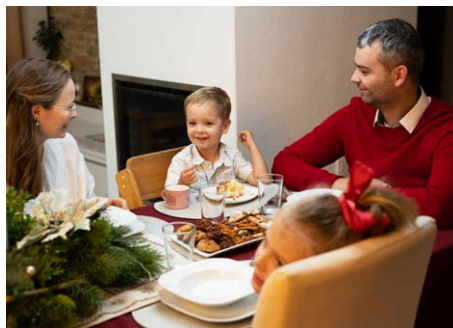
Sviatočná večera, ako ju poznáme u nás