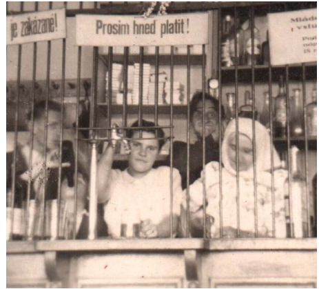
Krčma, fotograf Štefan Valent.

V dávnej minulosti územie dnešného Závodu tvorili jazerá a rozsiahle močiare a rašeliniská. Boli však dobre známe – viedla cez ne najznámejšia obchodná cesta staroveku: Jantárová cesta. Cesta postupne zanikla, no jej časti zostali. Patrí medzi ne aj tá – vedúca naším chotárom. Viedla od Jadranu k Baltu a najväčší rozmach zažila v dobách, keď sa na našom území pohybovali Rimania. Za cisára Claudia (41-54) založili tábor legiónárov v blízkom Carnunte (dnešný Bad Deutsch-Altenburg v Rakúsku). Odtiaľ viedla jedna jej vetva v smere na Brno cez Devín popri rieke Morave aj cez náš chotár. U nás ju križovala ďalšia cesta odbočujúca z obchodnej cesty vedúcej v smere zo Senice na Jablonicu a priesmyk cez Malé Karpaty. Niekde pri Jablonici