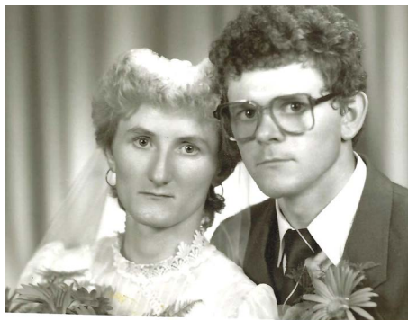
Huňadyovci sa zobrali po dvoch rokoch spoznávania.

Poznáme to asi všetci – v nedeľu dopoludnia vypneme sporák či televízor, vyleštíme topánky a náhlime sa do kostola. Peši, na bicykli či autom. Na rannú či na „hrubú“. Po svätej omši už uháňame za povinnosťami. A popri nich sme si možno ani nevšimli, kto sedel vedľa nás v kostolnej lavici. Alebo komu sme kývli hlavou na znak pokoja. A pritom náš chrám je plný vzácných ľudí, ktorí pracujú či žijú na Božiu slávu. Svetská pýcha či ľudská chvála pre nich nie sú hodnotou. Táto rubrika slúži aj na to, aby sme sa vo farnosti lepšie spoznali.