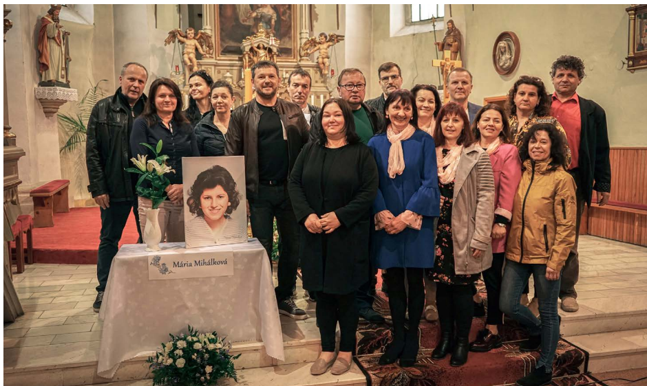
Chrámový spevokol farnosti Radošovce.