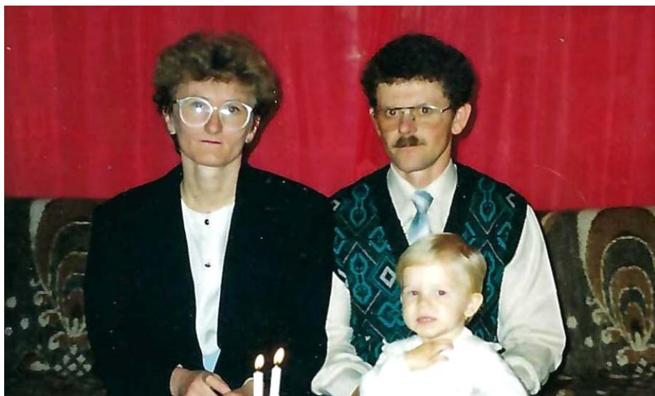
S dcérou Gabikou.

Málokomu uniklo, že do našej farnosti pribudli nový manželský pár: