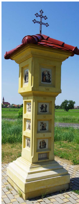
Božia muka na križných cestách.

S povestou o vzniku Závodu prežila aj jedna malá zmienka o dvoch vzácných pútnikoch. V povesti sa hovorí, ako Sv. Cyril a Metod počas svojho príchodu na Veľkú Moravu išli cez našu obec. Naši predkovia na znak úcty a vďaka zasvätili Božiu muku na križných cestách za obcou v smere na Tomky práve im. Predpokladali, že to bolo miesto ich odpočinku a takto si ho pripomínali. No a pri výzdobe nového kostola Sv. Michala archanjela dostali vierozvestcovia svoje významné miesto aj tam.