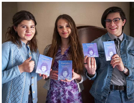
Mladí herci zo scény.

V roku 1995 sa môj brat, ako novokňaz, dostal na prvé kaplánske miesto do Zlatých Moraviec. Má-