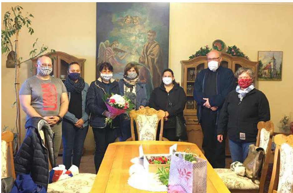
Redakčná rada v rúškach – korona ovplyvnila aj gratuláciu našej šéfredaktorky.

Nerozhadzujeme. Formát časopisu je malý, farebnú máme len obálku, ostatné strany sú čiernobiele. Aj to šetrí nejaké financie. Cena Svitania – jedno euro – pokrýva náklady. Nik na tom nezarába, všetci redaktori pracujeme bez nároku na honorár, po večeroch a cez víkendy.