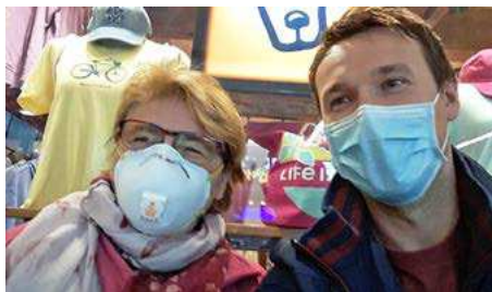
Pred odletom späť domov. Na letisku už boli rúška nevyhnutné.

Na letisku v Toronte našla pomoc u dvoch zamestnancov letiska. Zbadala uniformy a podľho za nimi! Jedného z mužov poťahala za rukáv a strčila mu do ruky papier. „Prečítal si ho a začal mi niečo vysvetľovať. Nič som nerozumela. Tam je všetko napísané! ukazovala som na papier. Len mi ukážte,