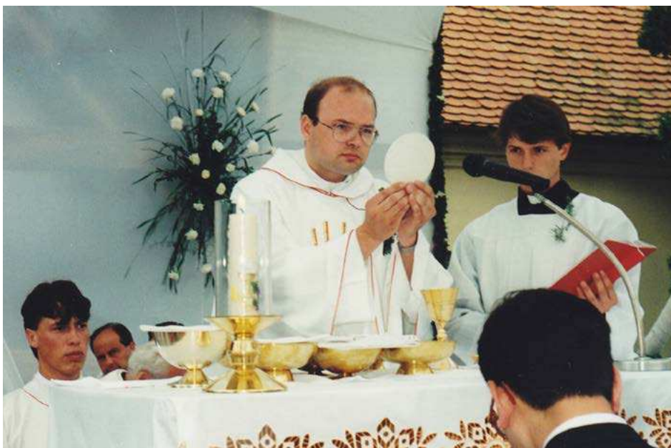
Primičná sv. omša v rodných Radošovciach.