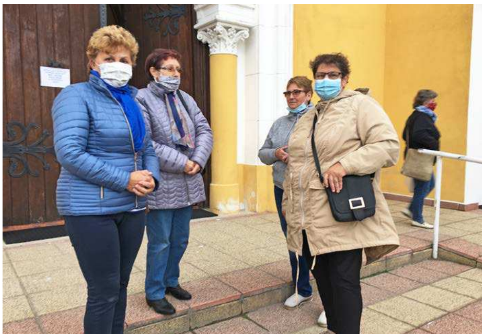
Rúška sa stali našou povinnou výbavou.