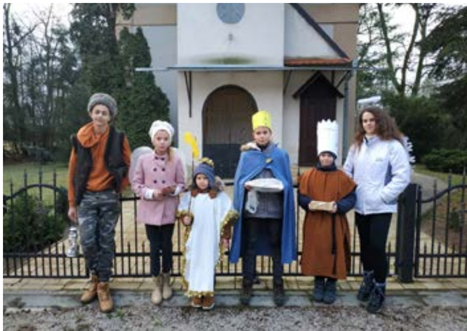
Koledníci tentoraz začínali na Húškoch.