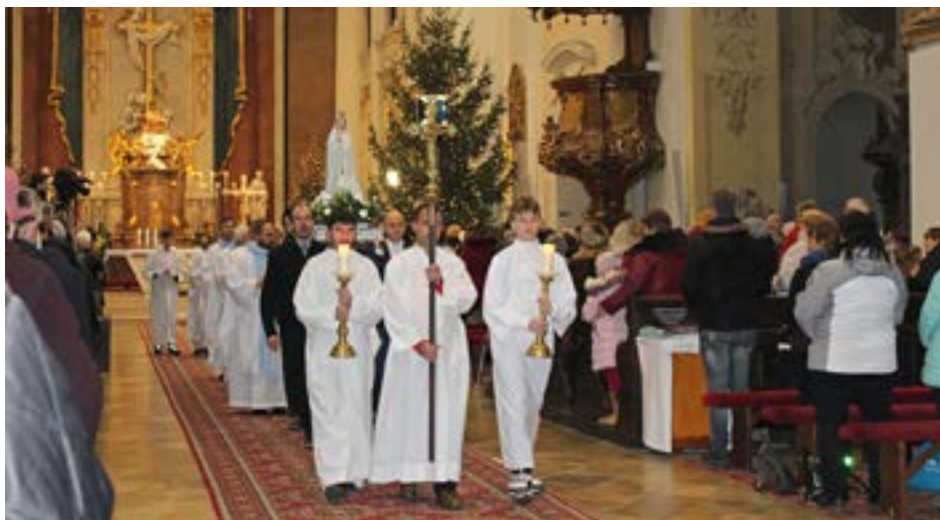
Mladí muži z našej farnosti sprevádzaní fatimskou hymnou niesli sochu Panny Márie pred oltár.

Ozbrojených síl Slovenskej republiky. Mladí muži z našej farnosti sprevádzaní fatimskou hymnou niesli sochu Panny Márie pred oltár. Na úvod pobožnosti sme sa zjednotili v spoločnej modlitbe radostného ruženca a rozjímaní nad jeho tajomstvami. V homílii sa otec biskup prihovril pútnikom na tému Mária – príčina našej radosti. Cirkev nám dáva do popredia Panu Máriu ako ženu radosti. Povzbudil veriacich, aby žili svoj život v radosti. I keď prídu ťažké chvíle, aby ich srdce zostalo naplnené radostou. Závodčania sa zapojili do liturgie čítaním Božieho slova a prinášaním obetných darov na oltár. Posilnení Eucharistiou a Božím požehnaním sme radost' z duchovného zážitku v Šaštíne priniesli aj svojim blízkym a čerpali sme z neho v nastávajúcich dňoch. Alena