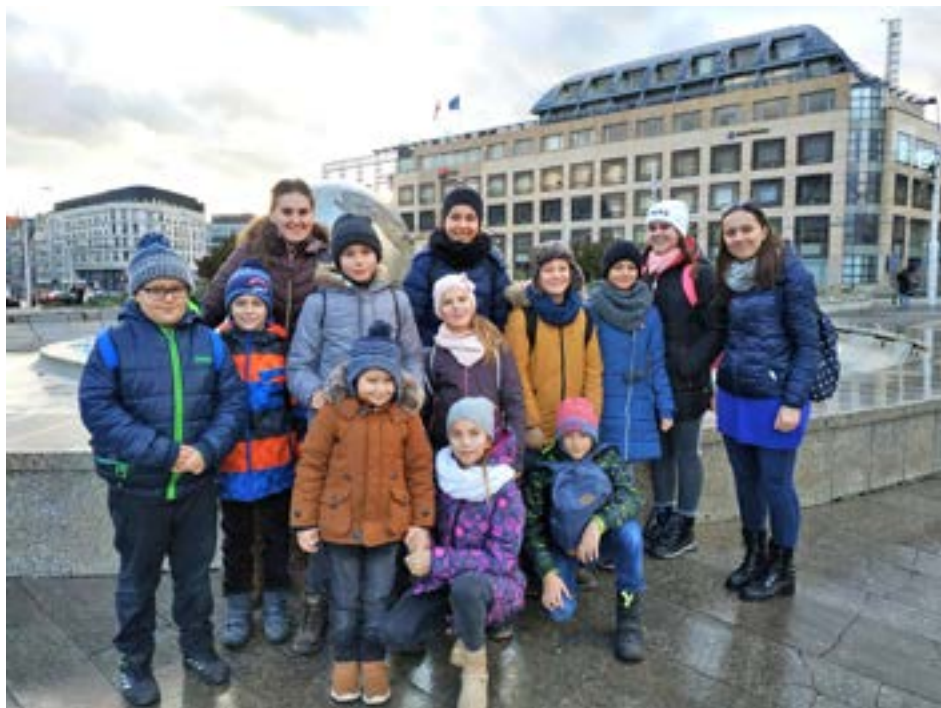
Spoločná fotografia našej výpravy.