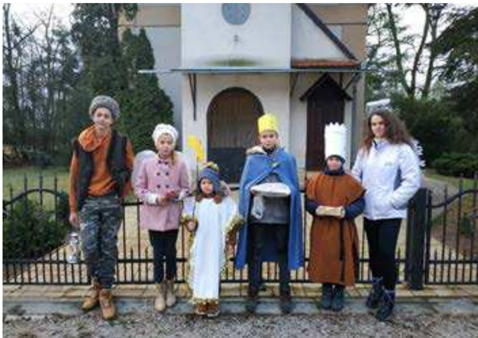
Koledníci tentoraz začínali na Húškoch.