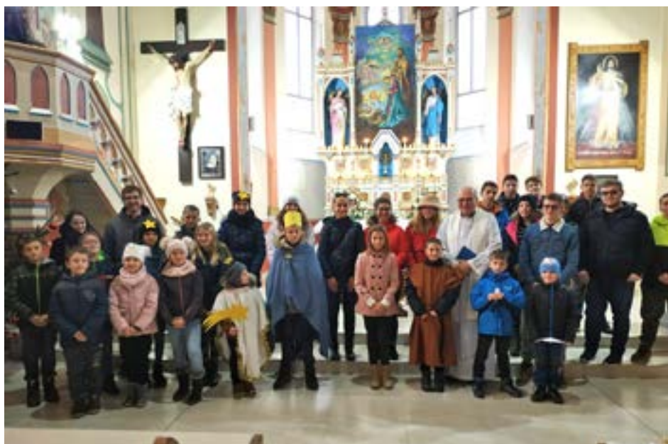
Ešte požehnanie od pána farára a ideme koledovať!