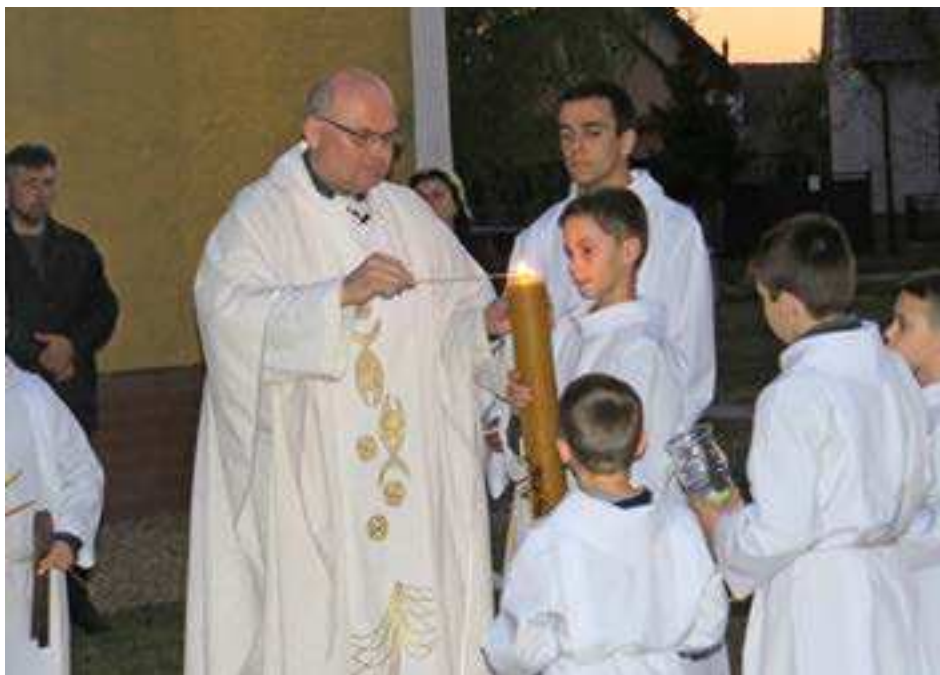
Na Bielu sobotu za súmraku zapalauje kňaz paškál.

Len pri takomto dennom počúvaní môžem aj ja, aj ty splniť a splňať úlohy od Pána.