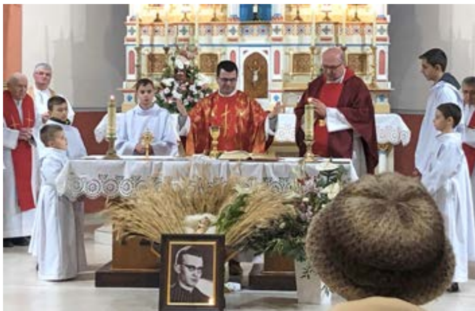
Najvhodnejším dňom na návrat bl. Titusa Zemana do farnosti sa ukázal 8. január.