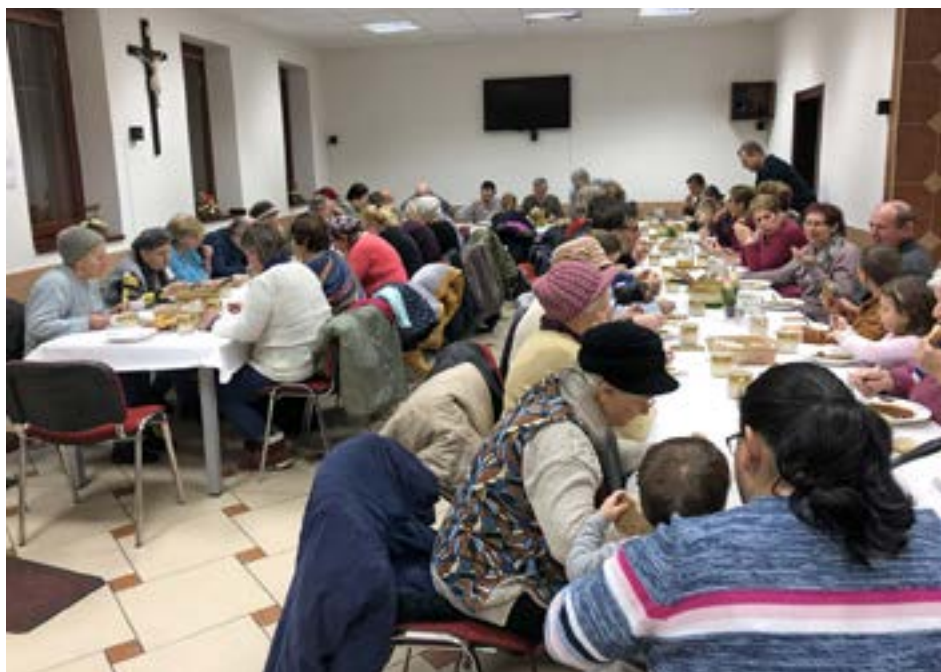
Podujatie pokračovalo večerou a diskusiou v pastoračnom centre.