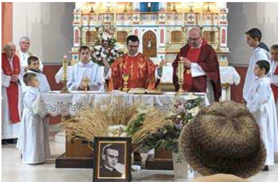
Najvhodnejším dňom na návrat bl. Titusa Zemana do farnosti sa ukázal 8. január.