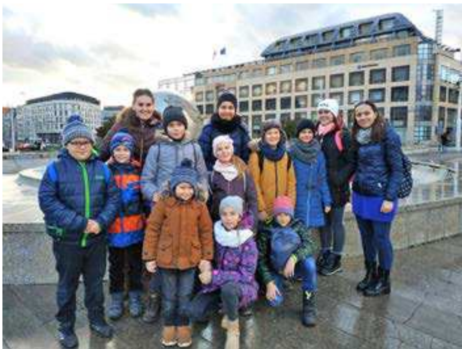
Spoločná fotografia našej výpravy.