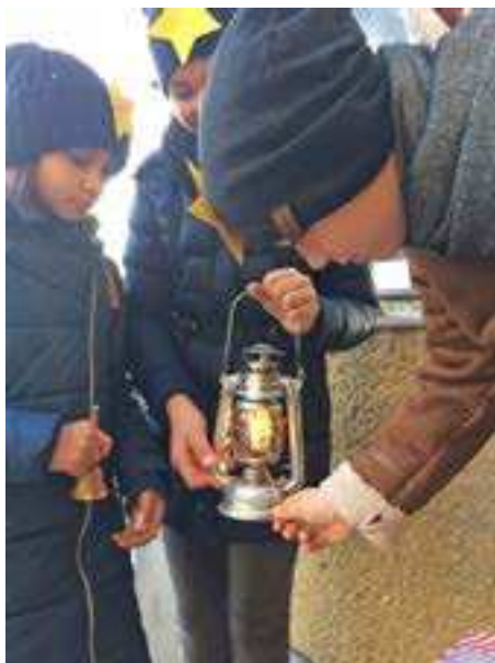
Len aby nám vietor nesfúkol plameň.