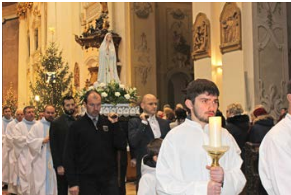
Pobožnosť prvých sobôt je spojená so zjaveniami Panny Márie vo Fatime v roku 1917.