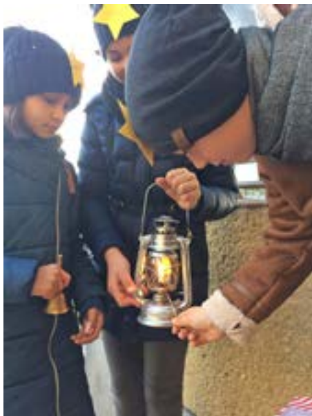
Len aby nám vietor nesfúkol plameň.