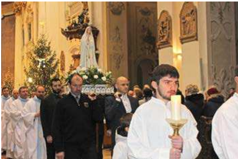
Pobožnosť prvých sobôt je spojená so zjaveniami Panny Márie vo Fatime v roku 1917.