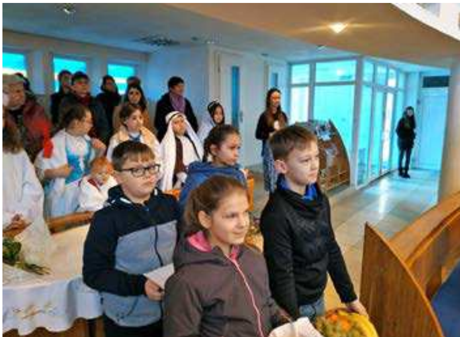
Naši koledníci niesli na vysielacej svätej omši dary pred oltár.