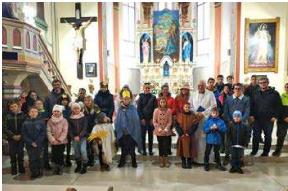
Ešte požehnanie od pána farára a ideme koledovať!