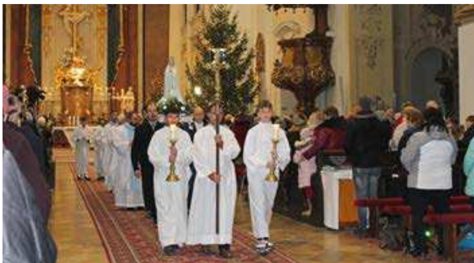
Mladí muži z našej farnosti sprevádzaní fatimskou hymnou niesli sochu Panny Márie pred oltár.

Ozbrojených síl Slovenskej republiky. Mladí muži z našej farnosti sprevádzaní fatimskou hymnou niesli sochu Panny Márie pred oltár. Na úvod pobožnosti sme sa zjednotili v spoločnej modlitbe radostného ruženca a rozjímaní nad jeho tajomstvami. V homílii sa otec biskup prihovril pútnikom na tému Mária – príčina našej radosťi. Cirkev nám dáva do popredia Panu Máriu ako ženu radosťi. Povzbudil veriacich, aby žili svoj život v radosťi. I keď prídu ťažké chvíle, aby ich srdce zostalo naplnené radosťou. Závodčania sa zapojili do liturgie čítaním Božieho slova a prinášaním obetných darov na oltár. Posilnení Eucharistiou a Božím požehnaním sme radosť z duchovného zážitku v Šaštíne priniesli aj svojim blízkym a čerpali sme z neho v nastávajúcich dňoch. Alena