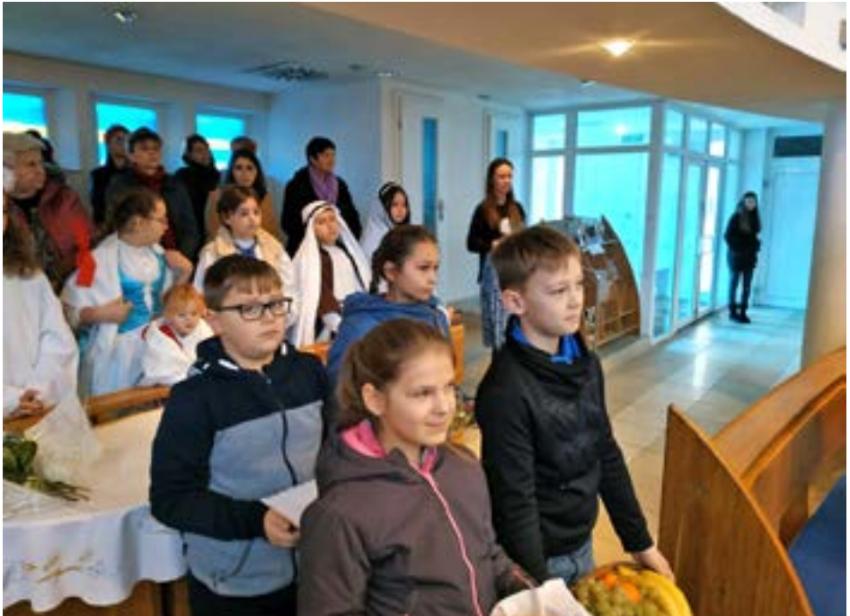
Naši koledníci niesli na vysielacej svätej omši dary pred oltár.