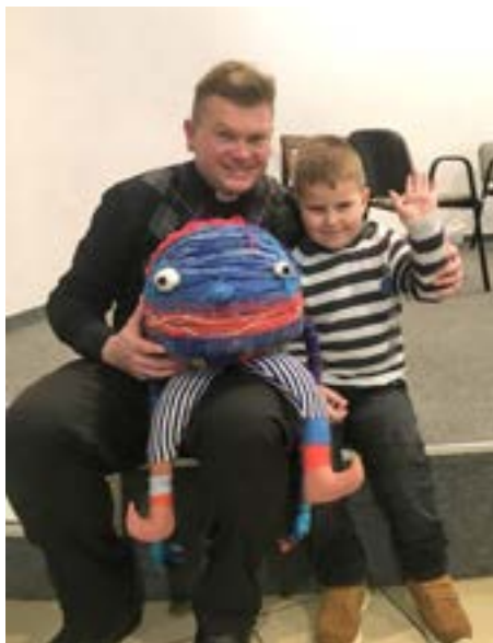
Vidieť Klbka naživo, to bol zážitok!