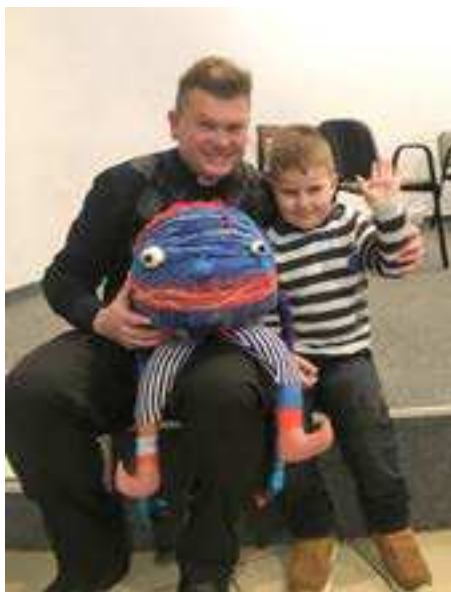
Vidieť Klbka naživo, to bol zážitok!