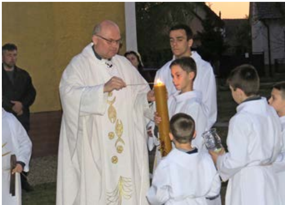
Na Bielu sobotu za súmraku zapalauje kňaz paškál.

Len pri takomto dennom počúvaní môžem aj ja, aj ty splniť a splňať úlohy od Pána.