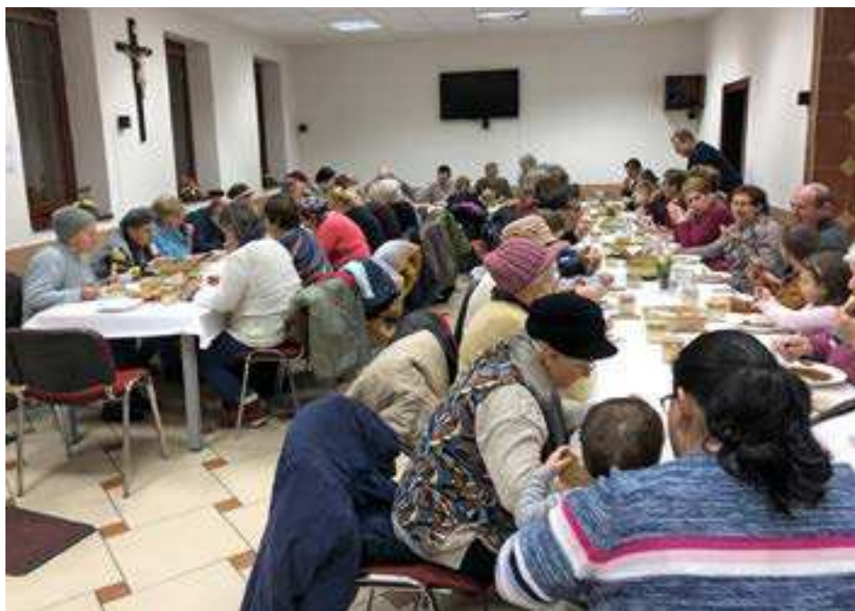
Podujatie pokračovalo večerou a diskusiou v pastoračnom centre.