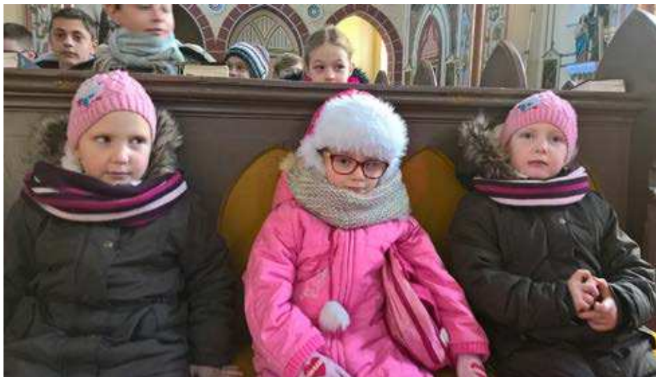
Koledy o Ježiškovi sú tie najkrajšie...

tomu sa medzi deťmi vyskytli isté pochybnosti a možno nie sú ojedinelé. Počas koledovania sa ma dievčatá z mojej skupinky pýtali, čo sa dokáže vybudovať v Afrike za peniaze, ktoré v Závode vyzberáme. Bude to stačiť? Otázok bolo viac. Rovnako aj ja som mala pochybnosti – je spôsob nášho koledovania dostačujúci? Ako docieľať, aby sa vyzbieralo ešte viac peňazí? Sú napríklad dediny, kde sa koleduje „od domu k domu“, nielen v rodinách, ktoré sa prihlásili. Uvedomila som si a aj mojim pochybujúcim dievčatám som sa snažila vysvetliť to na slovách Matky Terezy: „Netúžte robiť veľké veci a hrdinské skutky. Robte tie malé veci, ktoré robíte, tie malé skutky, ale s veľkou láskou.“ Myslím si, že toto všetci, nech sme akokoľvek prepojení s Dobrou novinou, spĺňame.