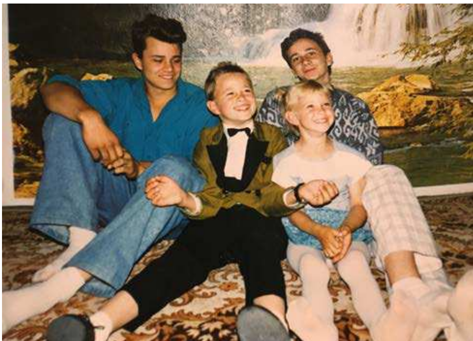
Moje deti, dar Boží.