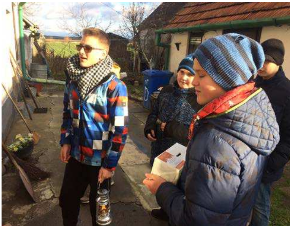
Priniesli sme vám Betlehemské svetlo.

Tento rok bude Dobrá novina oslavovať 25. výročie svojho vzniku. Pri tejto príležitosti boli všetky farnosti, kde sa aktívne koleduje, požiadané, aby poslali koordinátorom Dobrej noviny krátke video o priebehu koledovania v jednotlivých farnosti. Vytvorené videá budú potom premietané deťom a partnerom Dobrej noviny v Afrike. Aj my sme video vytvorili a poslali. Je zložené z aktuálnych, ale obsahuje aj zopár minuloročných fotografií u nás počas koledovania. Druhú časť videa tvoria minuloročné krátke zostrihy kolied a veršikov, ktoré deti recitovali.