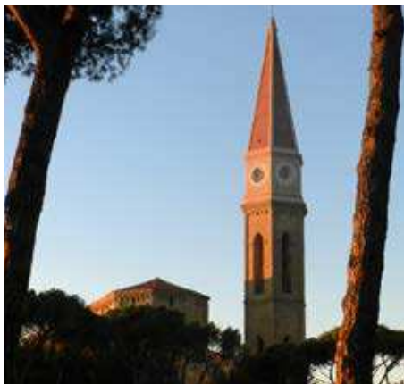
Zvonica Katedrály sv. Donáta v Arezzo.

Áno, existuje a to priamo v meste Arezzo! Prototyp zvonice nášho kostola pochádza zo zvonice Katedrály sv. Donáta v meste Arezzo. Náš kostol bol postavený v 19. storočí. Katedrála v Arezzo