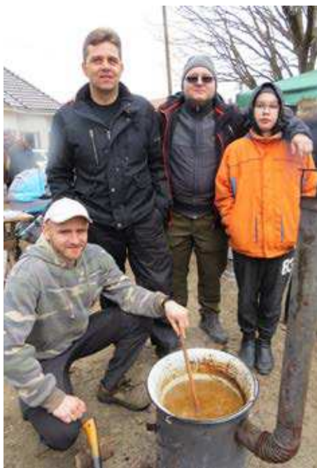
Tím Farníci v omladenom zložení varil guláš aj v 8. ročníku podujatia Gulášmajster.