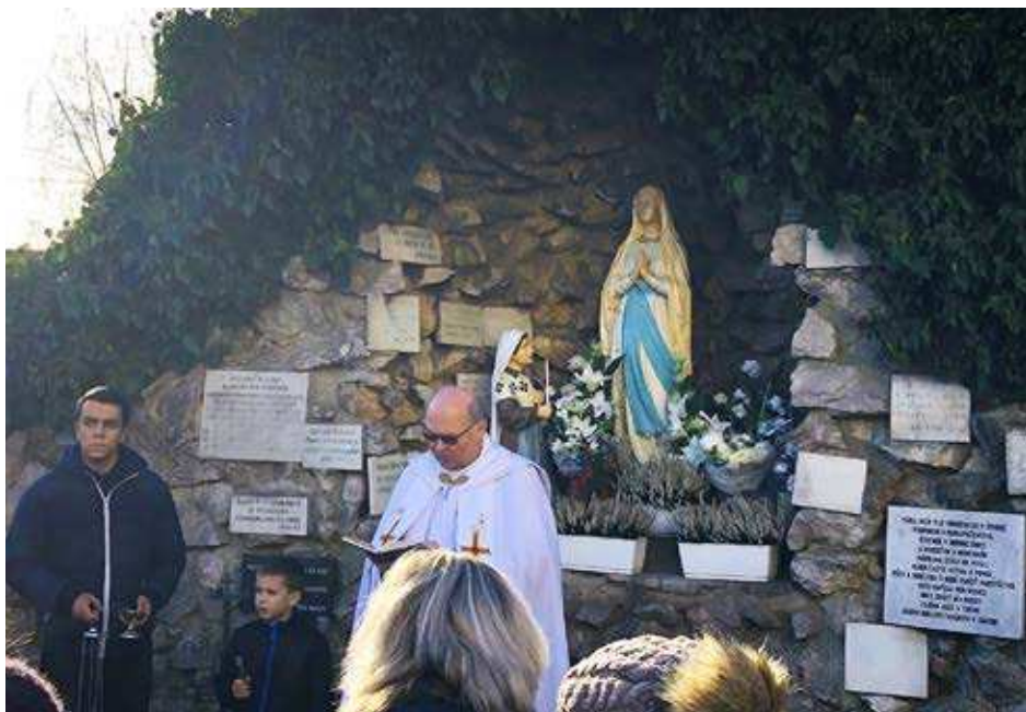
Socha Bernadety je opäť na svojom mieste.

Bernadeta žila v jednoduchých a chudobných pomeroch. Od detstva bola chorá, mala ťažkú astmu a kostnú tuberkulózu nôh. Napriek tomu sa s láskou starala o mladších súrodencov. Nechýbala jej ani viera, viedli ju k nej rodičia. Panna Mária sa Bernadete zjavila spolu osemnásťkrát. Spočiatku Bernadete nikto neveril, zažila veľa príkoria od ľudí i svetskej a cirkevnej vrchnosti. Posolstvá zo zjavení boli hlavne výzvou na pokánie a modlitby