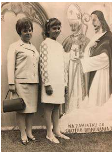
Na birmovke s krstnou mamičkou.

Keď sa vraciam späť rokmi svojho života, žasnem nad tým, ako si ma po celý čas náš Pán viedol. Tolkokrát som zlyhala a On i moja dobrá matka Panna Mária boli vždy pri mne, hoci som si to neuvedomovala. Nič sa neudeje zo dňa na deň. Služba kostolníčky je pre mňa veľký dar. Dotýkam sa vecí, v ktorých je prítomný Ježiš. To je pre mňa, nehodnú, obrovský dar. Moja cesta k službe bola kľukatá a plná prekážok. Dnes však môžem povedať, že