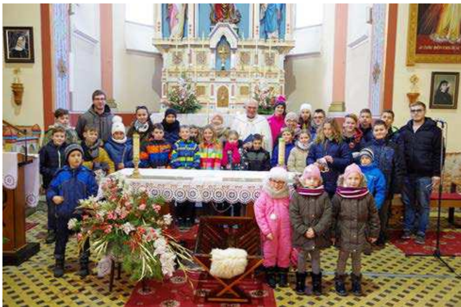
Požehnanie na cestu od pána farára a ideme koledovať!

Veľmi sa tešíme a sme vďační vám, darcom, že suma, ktorú z našej obce posielame na konto Dobrej noviny, sa každým rokom zvyšuje. Aj napriek