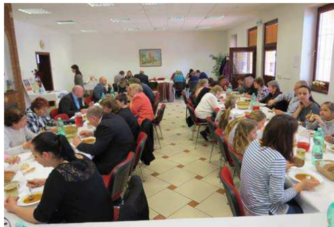
Takto sme spolu obedovali vlani. Vzdať sa nedeľnej hostiny pri domácim stole a vymeniť ju za dobrý pocit z pomoci núdznym stojí za to.

Srdečne Ťa pozývame a tešíme sa na Teba!