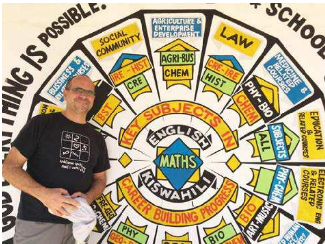
Afriku navštevuje často a rád. Podľa vlastných slov ho robí lepším.