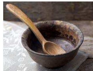
Pôst nám dáva príležitosť viac sýtiť ducha.

Na dolnom konci u Kopiarov mali dielňu a tam sa lisoval konopný olej.