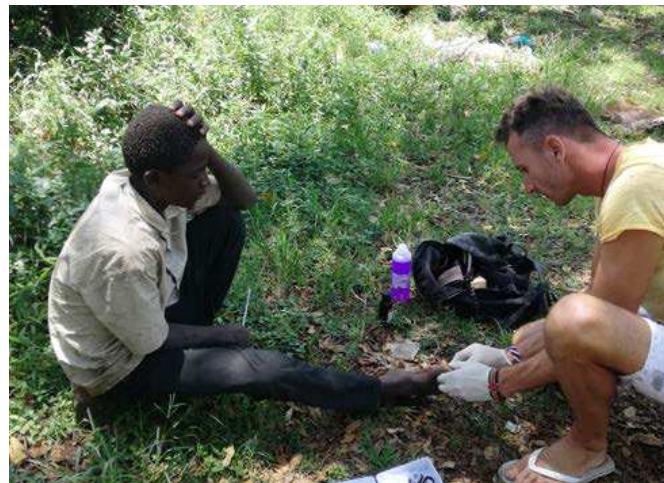
Na svojej misii sa Závodčan stretáva s rôznymi situáciami. Už pomáhal pri pôrode, snažil sa o záchranu života či ošetroval otvorené rany.

Na Bielu sobotu k nám prišiel 8-ročný chlapec. Priviedol ho neznámy pán. Chlapec tvrdil, že nikoho nemá a nevie odkiaľ je. No tu v Keni sú metódy, ako sa dostať k pravde – nie-