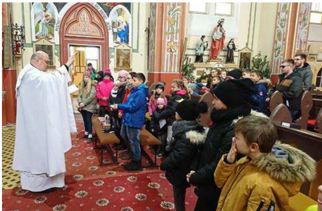
Požehnanie na cestu od pána farára...

stredisko v etiópskej Alitene. Sestry Vincentky sa tam venujú pôrodnej a popôrodnej starostlivosti matiek a detí. Veľká čiastka je vyhradená na nákup sanitiek - je kľúčové, aby ženy rodili v bezpečnom a čistom prostredí, boli včas pod dohľadom lekára a neohrozovali svoj život a život dieťaťa. Rovnako je nesmierne dôležitý rýchly príchod lekára k iným vážnym prípadom, pretože Alitena sa nachádza v ťažko dostupnom horskom teréne. Preto cesta pešo, ako rýchly spôsob prepravy, neprichádza