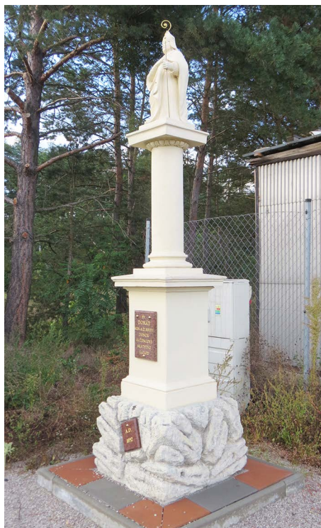
Obnovená socha sv. Donáta stojí na svojom pôvodnom mieste za železničným priecestím.