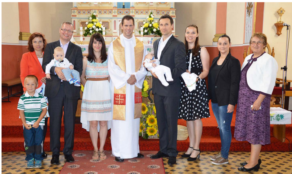
Fotografia do rodinného albumu Šišolákovcov...